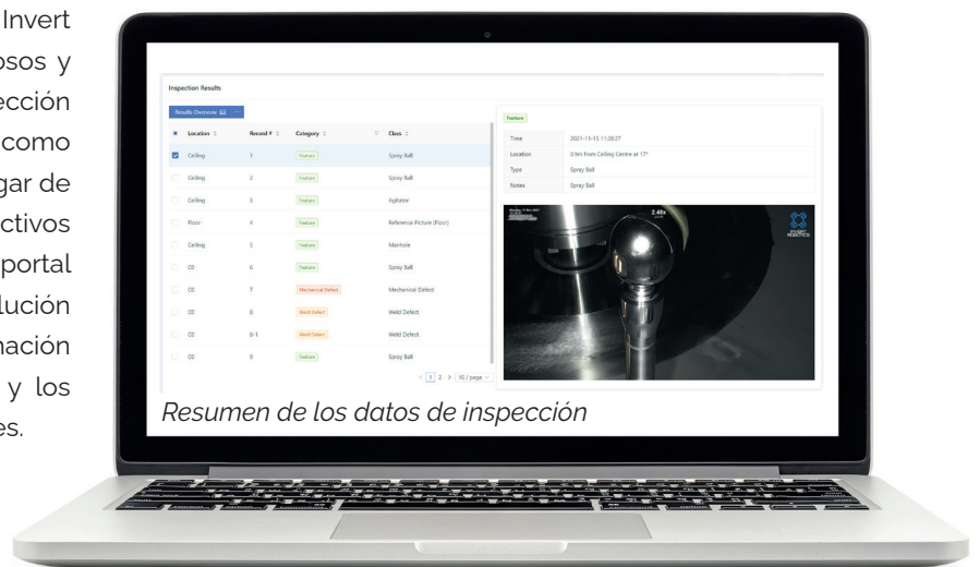
Resumen de los datos de inspección

El portal de datos de Invert Robotics elimina los engorrosos y laboriosos informes de inspección tradicionales entregados como archivos PDF en papel. En lugar de una visión estática de sus activos en un único momento, el portal de datos le ofrece una solución basada en la nube con información completa sobre los activos y los resultados de las inspecciones.